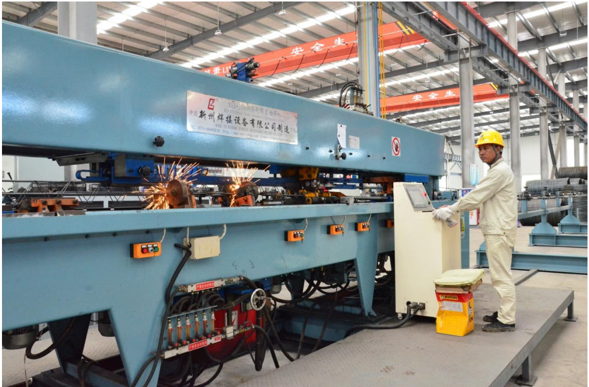
图为我司控股的三明杭萧钢构公司工厂内，工人操作专业设备制作钢构件。